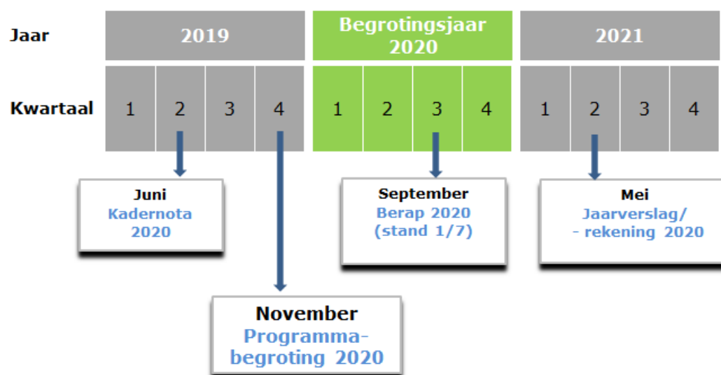
Figuur 1: P & C – cyclus 2019

In de raadsvergadering van 27 juni a.s. wordt, tegelijkertijd met deze kadernota, de jaarrekening over het jaar 2018 aan u ter vaststelling voorgelegd. Evenals deze kadernota een document uit de planning en controlcyclus; de Jaarstukken 2018 zijn het sluitstuk over het verslagjaar 2018 en de Kadernota 2020 blikkt vooruit en is het eerste document voor het nieuwe jaar 2020.