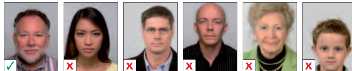
GOED A. Niet gecentreerd B. Niet gecentreerd C. Hoofd te hoog D. Hoofd te hoog E. Hoofd te laag