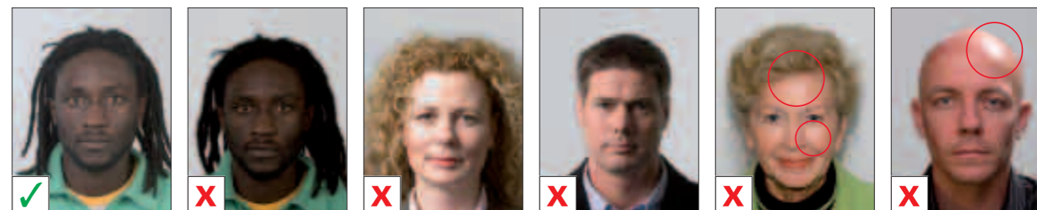
GOED A. Onderbelicht B. Overbelicht C. Schaduw gezicht D. Reflectie E. Reflectie (witte vlekken)