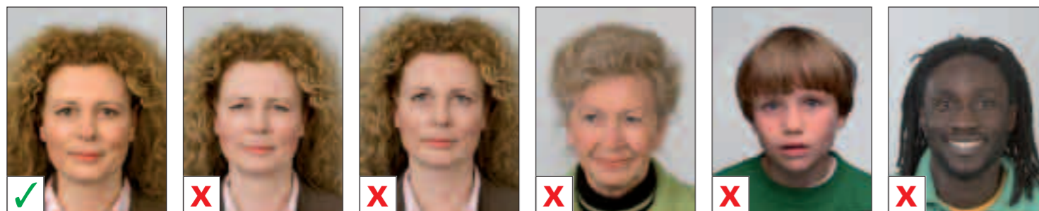
GOED A. Geen neutrale blik B. Niet recht in de camera kijken C. Niet recht in de camera kijken D. Mond niet gesloten E. Mond niet gesloten