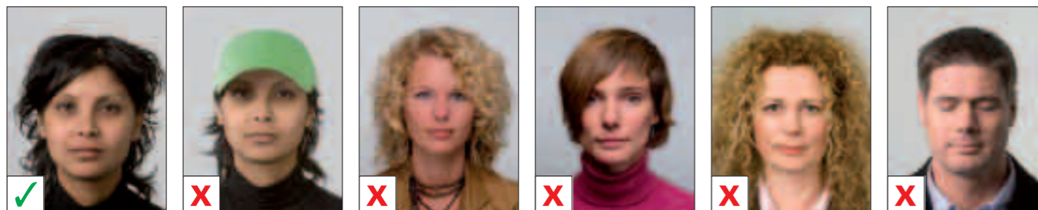
GOED A. Hoofd bedekt B. Gezicht niet volledig zichtbaar C. Gezicht niet volledig zichtbaar D. Gezicht niet volledig zichtbaar E. Ogen niet zichtbaar