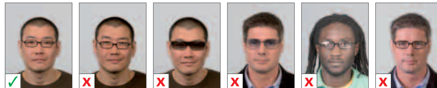
GOED A. Ogen niet volledig zichtbaar B. Getint glas C. Getint glas D. Reflectie E. Schaduw van bril