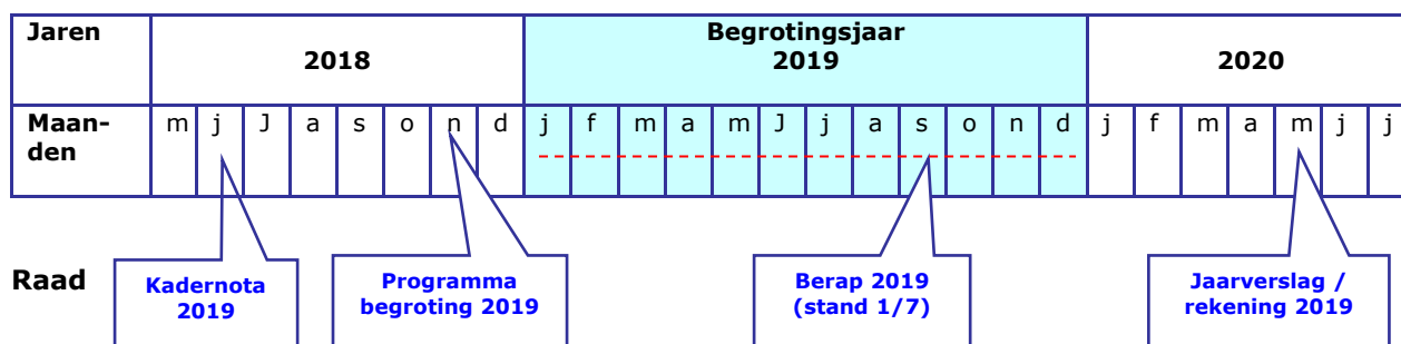
P&C – cyclus

Binnen het nieuwe vergadermodel Politieke Avond Montferland zal deze Bestuursrapportage worden aangeboden voor raadsbehandeling op 12 september 2019. Verdere agendering wordt bepaald door de Agendacommissie.