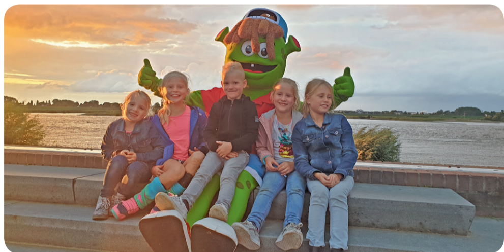
Mascotte Sjors Sportief en Creatief laat kinderen kennismaken met sport en cultuur

Alle basisschoolleerlingen hebben eind oktober het Sjors boekje ontvangen. Het boekje is gevuld met bijna 100 pagina's vol met sport en cultuur. Er valt dus meer dan genoeg te kiezen. Het boekje is ook