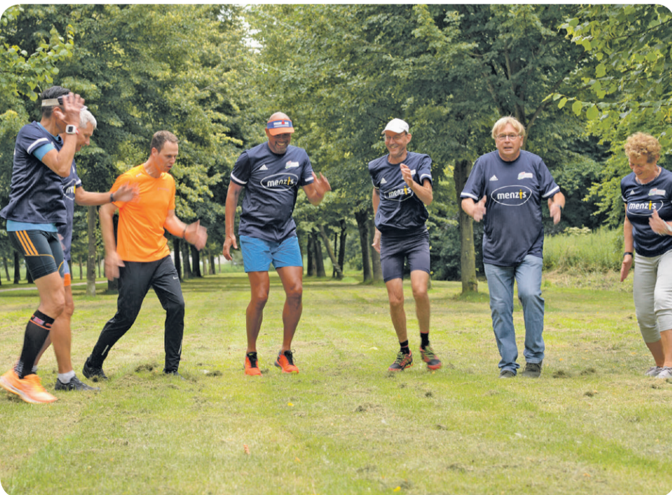
OldStars Running als nieuw initiatief om 55-plussers in beweging te brengen