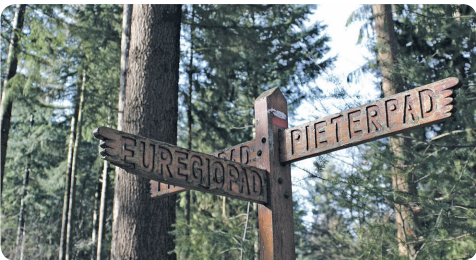
Indy van den Berg