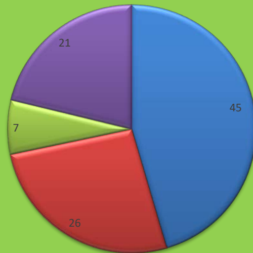
Besluiten op bezwaar en intrekkingen en herziene besluiten

■ 45 % ongegrond ■ 26 % (gedeeltelijk) gegrond ■ 7 % niet-ontvankelijk ■ 21 % ingetrokken /herzien